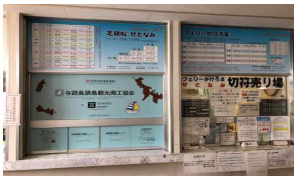
(コンシェルジュデスク:せとなみチケット売上横に開設)