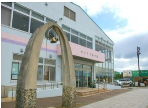
(写真1:海の駅の外観)

・営業日：毎週日曜と水曜日(将来的には、常駐スタッフを設置予定) ※2021年7月26日オープン