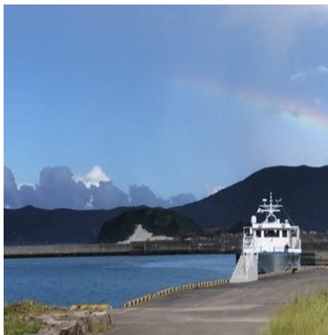
与路港からの眺め